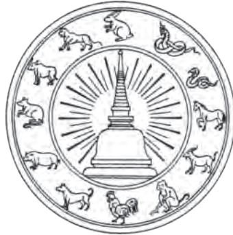
ภาพที่ 1: สัญลักษณ์เมืองสิบสองนักษัตร

กล่าวได้ว่า การนับปีนักษัตรในไทยนั้นมี 2 แบบ คือ