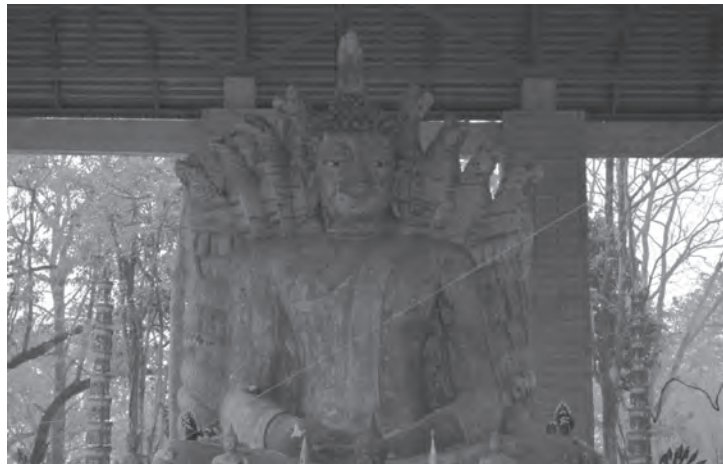
พระพุทธรูปปางนาคปรก (สมัยพระไชยเชษฐาธิราช) วัดพระธาตุบังพวน จ.หนองคาย

อีกเหตุผลหนึ่ง เรื่องราวของมังกร(หรือนาค)มีปรากฏในวัฒนธรรมต่างๆ ในแถบกลุ่มประเทศอาเซียน ซึ่งโดยมากจะเห็นว่าเป็นประเทศที่นับถือพระพุทธศาสนา มีความเป็นไปได้ที่ความเชื่อเหล่านี้มาจากพระพุทธศาสนาโดยตรง ซึ่งชี้ให้เห็นได้ว่าความเชื่อเรื่องนาคในพระพุทธศาสนาอาจเป็นจุดเริ่มของมังกรที่ผสมผสานกับความเชื่อท้องถิ่นก็เป็นได้