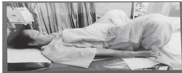
ภาพที่ 4 แสดงขั้นตอนการเบ่งคลอด

ประยุกต์ใช้หลักธรรม วิริยารัมภกถา ปัญญาภกถา วิมุตติภกถา และวิมุตติญาณทัสนกถา