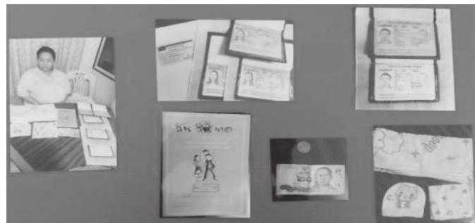
ภาพที่ 2 แสดงจำนวนของใช้ที่จำเป็นในการมาตลอด ประยุกต์ใช้หลักธรรม อับปิจกถา