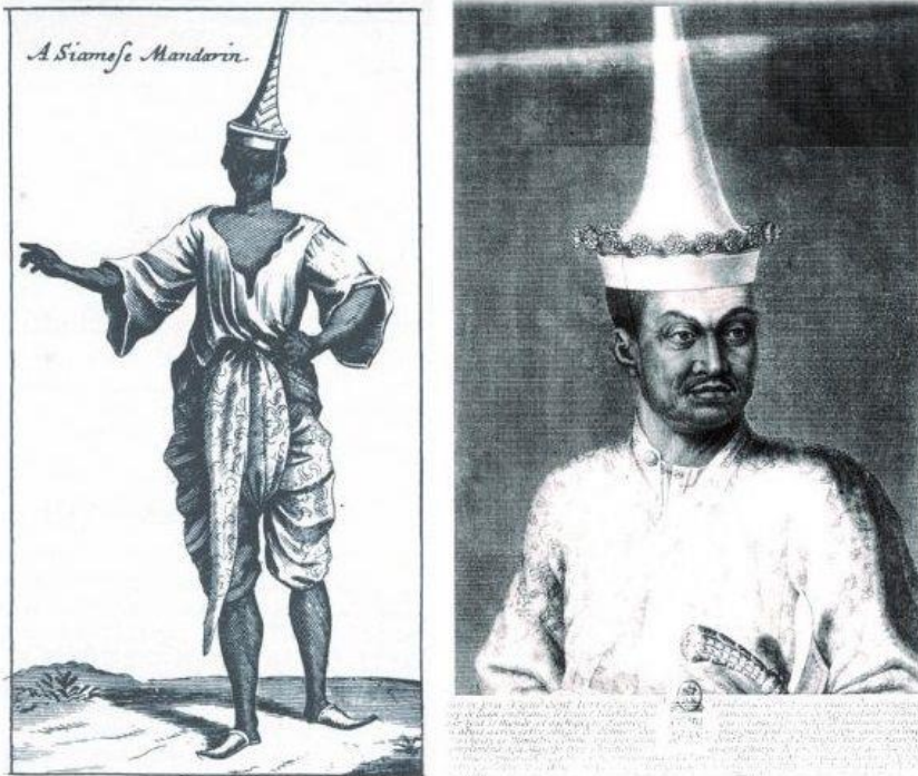
(ซ้าย) ขุนนางสยาม ลายเส้นจากหนังสือจดหมายเหตุลา ลูแบร์ (ขวา) ออกญาโกษาธิบดี (ปาน) ภาพที่ 3 ขุนนางสยาม ลายเส้นจากหนังสือจดหมายเหตุลา ลูแบร์ (ขวา) ออกญาโกษาธิบดีปาน

เป็นอย่างมาก ดังนั้นภาพสะท้อนอิทธิพลทางภาษา ศาสนา และวัฒนธรรมยังปรากฏเหลือเป็นร่องรอยและเชื่อมโยงให้เห็นความเกี่ยวเนื่องในความเป็นศิลปวัฒนธรรมในประเทศไทย รวมทั้งยังมีงานวิจัยของอีกหลายท่านที่สะท้อนถึงความเชื่อมโยงของดินแดนที่เป็นประเทศไทยกับการเชื่อมโยงในมิติทางประวัติศาสตร์และวัฒนธรรมของประเทศนี้ด้วยเช่นกัน