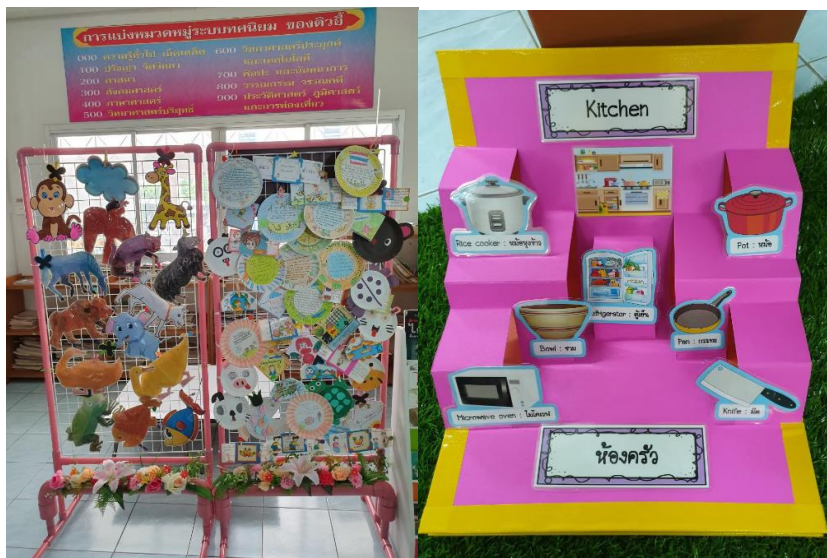
ภาพที่ 4 การสร้างบรรยากาศการเรียนรู้โดยใช้ห้องสมุดเป็นฐานในรายวิชาภาษาอังกฤษสำหรับ ประถมศึกษาชั้นปีที่ 2 (ภาพ โรงเรียนวัดแสงสรรค์, มกราคม 2562)