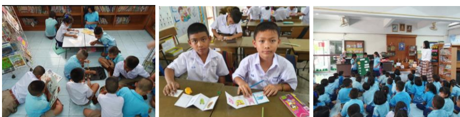
ภาพที่ 1 การเรียนภาษาอังกฤษ ป.2 ที่บูรณาการกับนิเวศการเรียนรู้ในห้องสมุดโรงเรียน

ด้วยเหตุนี้ภาษาอังกฤษจึงมีการใช้ทั่วโลกมากกว่าภาษาอื่น ๆ การเรียนการสอนก็มีการพัฒนาขึ้นเรื่อย ๆ มีการใช้ในการติดต่อในสถานการณ์ต่าง ๆ ที่เหมาะสม เช่นเดียวกับการเรียนรู้ภาษาแรกจากพ่อแม่ ที่เป็นการเรียนรู้แบบธรรมชาติ ไม่จำเป็นที่จะต้องรู้คำศัพท์ คำแปล หรือไวยากรณ์ ดังนั้นการเรียนการสอนนั้นต้องเน้นการมีส่วนร่วมมากที่สุด คือผู้ฟังต้องเรียนรู้การฟังการพูดอย่างเป็นธรรมชาติที่สุด เริ่มจากการพูดในครอบครัว แล้วขยายไปยังภายนอก ดังนั้นในปัจจุบันนี้ภาษาอังกฤษมีบทบาทสำคัญยิ่งและเป็นตัวจักรสำคัญที่จะช่วยให้ประเทศไทยพัฒนาได้ทันต่อการเปลี่ยนแปลงของสังคมโลก โดยมุ่งใช้ความก้าวหน้าของสังคมฐานความรู้ และนวัตกรรมทางเทคโนโลยี สารสนเทศเป็นปัจจัยชี้้นำในการเพิ่มขีดความสามารถในการแข่งขันของประเทศ โดยเฉพาะอย่างยิ่งประเทศไทย จะต้องเตรียมความพร้อมของบุคลากรให้มีสมรรถนะทางด้านภาษาเพื่อรองรับประชาคมเศรษฐกิจอาเซียน และจะทำให้เกิดการเคลื่อนย้ายแรงงานเสรีของประเทศในกลุ่มประชาคมเศรษฐกิจอาเซียน ดังนั้นการเตรียมความพร้อมของบุคลากรของประเทศเพื่อให้มีทักษะภาษาอังกฤษในระดับที่สามารถติดต่อสื่อสาร แสวงหาความรู้ สร้างความร่วมมือ เจรจาต่อรอง และสร้างความสัมพันธ์อันดีได้ จึงมีความสำคัญ เป็นอย่างยิ่ง