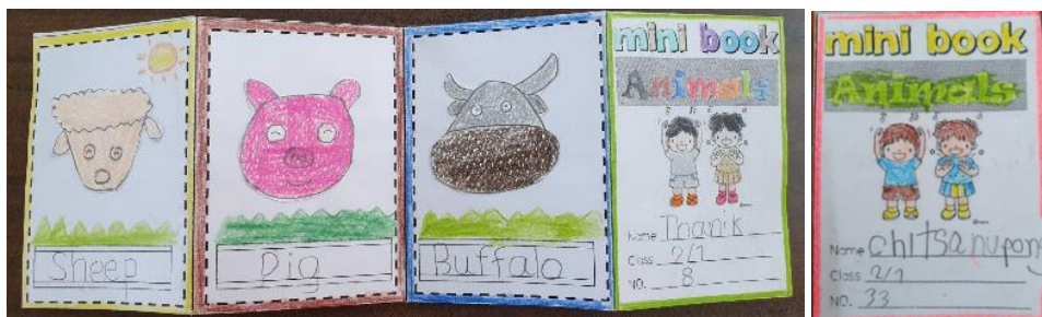
ภาพที่ 5 สิ่งสนับสนุนการเรียนรู้โดยใช้ห้องสมุดเป็นฐานในรายวิชาภาษาอังกฤษสำหรับประถมศึกษาชั้น ปีที่ 2 (ภาพ โรงเรียนวัดแสงสรรค์, มกราคม 2562)