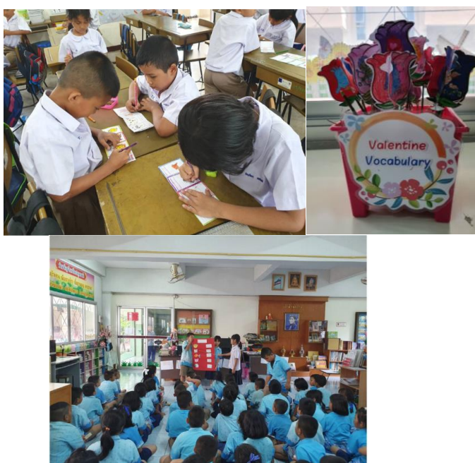
ภาพที่ 3 นิเวศการเรียนรู้ในห้องสมุดโรงเรียนที่บูรณาการกับรายวิชาภาษาอังกฤษสำหรับประถมศึกษา (ภาพ โรงเรียนวัดแสงสรรค์, มกราคม 2562)

และภาษาราชการของแต่ละประเทศ ย่อมได้เปรียบในการติดต่อสื่อสารรวมไปถึงภาพใหญ่ คือทำการค้าหรือกิจการต่าง ๆ เพราะไม่มีใครสามารถติดต่อกันได้รู้เรื่องถ้าใช้ภาษาที่ต่างกัน ในอดีตประเทศยังไม่มีความรู้ด้านภาษามากนัก ทำให้ต้องผ่านตัวแทนที่รู้ภาษาดีกว่า เช่น สิงคโปร์ ซึ่งประเทศเหล่านี้ล้วนให้ความสำคัญทางด้านภาษา โดยเฉพาะภาษาอังกฤษที่ถูกจัดว่าเป็นภาษาสากล นานาประเทศได้พัฒนาหรือพยายามพัฒนาเพื่อให้เกิดการขับเคลื่อนไปข้างหน้า และประกาศใช้เป็นภาษาทางราชการอีกภาษาหนึ่ง นอกเหนือจากภาษาประจำชาติของตนซึ่งรวมทั้งประเทศไทยด้วย