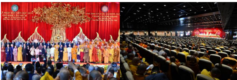
ภาพที่ 3 พิธีการเปิด จะมีผู้นำชาวพุทธจากประเทศต่าง ๆ