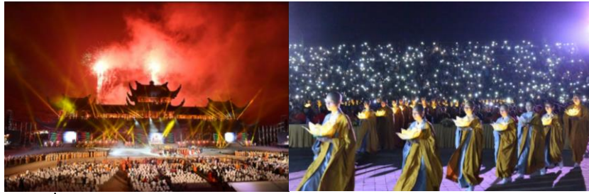
ภาพที่ 5 พิธีต้อนรับ แสงสีเสียง และเวียนเทียนของผู้นำชาวพุทธจากประเทศต่าง ๆ