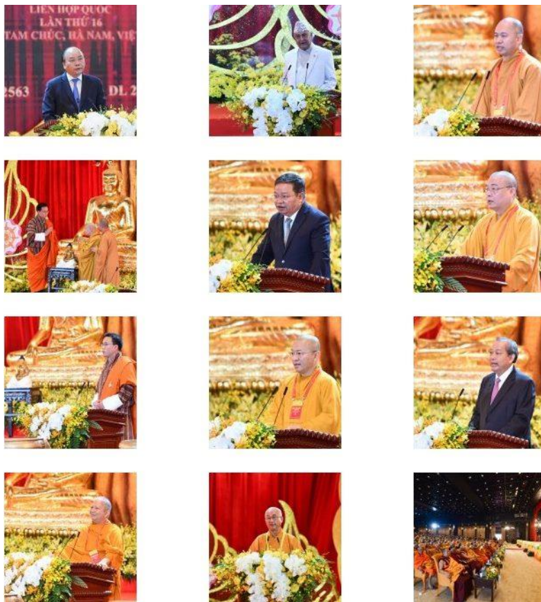
ภาพที่ 4 ผู้นำชาวพุทธจากประเทศต่าง ๆ กล่าวสุนทรพจน์ ปาฐกถา