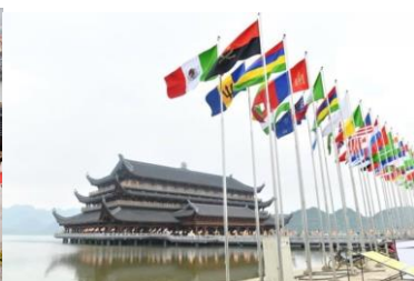
ภาพที่ 2 ภาพอาคารหอประชุมสำหรับผู้เข้าร่วมประชุมกว่า 2000 คน ที่ใช้เป็นทั้งพิธีเปิดและพิธีปิดในงานประชุมวิสาขบูชาครั้งที่ 16 ที่เมืองฮานาม ประเทศเวียดนาม

ระหว่าง 12-14 พฤษภาคม 2562