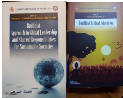
ภาพที่ 10 หนังสือที่จัดแจกมอบแก่ผู้เข้าร่วมงาน ที่นำแนวคิดทางพระพุทธศาสนามาประยุกต์กับแนวคิดทางการศึกษา และศาสตร์สมัยใหม่