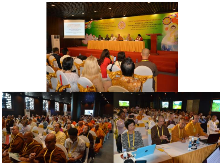
ภาพที่ 7 บรรยากาศการประชุมสัมมนาทางวิชาการของผู้นำชาวพุทธในแต่ละห้อง (ภาพ : ผู้เขียน 20 พฤษภาคม 2562)

5. พิธีเวียนเทียน การเวียนเทียนมีกิจกรรมร่วม ช่วงเวียนเทียนจะมีกิจกรรม ที่เนื่องด้วยการเวียนเทียน ที่มีพิธีในภาคดังกล่าวอย่างอลังการ และเป็นที่น่าสนใจ มีการจุดเทียนจำนวนมาก ทำให้ได้บรรยากาศของการจัดเวียนเทียน ที่ประทับใจและมีบรรยากาศของความศรัทธาที่ดี ควรค่าแก่การจดจำและที่น่าประทับใจอย่างยิ่งด้วยเช่นกัน