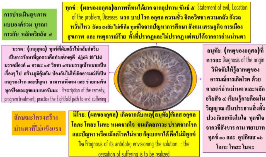
ภาพที่ 4 ผังวงจรกระบวนการทำงานของตาตามหลักอริยสัจ 4

ทุกขนิโรธคามินีปฏิปทาอริยสัจ เดินมรรค ด้วยอริยมรรคมีองค์ 8 อันเป็นทางเอกสายเดียวที่พาให้พ้นทุกข์ จนถึงจุดหมายคือ อุเบกขา อยู่เหนือกิเลสด้วย (อภ.วิ.(ไทย)35/189/163) มีสัมมาทิฐิ คือ รู้อริยสัจ 4 ก็จะเป็นคนที่มีปัญญา มีสติสัมปชัญญะ รู้แจ้ง รู้จัก รู้จริงในกายที่เป็นมโนวิญญาน รู้กิเลสที่เป็นรากเหง้าของปัญหาทุกปัญหา รู้จักกรรม รู้จิต เจตสิก รูป ทำกรรมด้วยจิตว่างจากกิเลส ว่างจากกามและตัณหา ลดโรคลดทุกข์ ลดปัญหาได้เป็นลำดับๆ