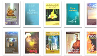
ภาพที่ ๒ วิเคราะห์นำเสนอ บทความวิจัยวรรณกรรม จำนวน ๑๐ เรื่อง