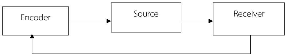
ภาพที่ 2 แบบจำลองกระบวนการสื่อสารแบบสองทางของชแรมม์

จะเห็นได้ว่าชาวพุทธเราจะเน้นในเรื่องของการประพฤติปฏิบัติเป็นส่วนใหญ่ เช่น การปฏิบัติธรรม การสวดมนต์ การเกรงกลัวต่อบาป และการนั่งวิปัสสนากรรมฐาน ซึ่งในโบราณเป็นลักษณะของการเทศน์ผ่านการสื่อสารแบบเผชิญหน้า โดยผ่านสื่อบุคคลที่มีลักษณะเป็นทางการ พระที่เทศน์ต้องนั่งบนธรรมมาสน์และถือคัมภีร์ ตามประเพณีเทศกาลทางศาสนาที่เราเคยพบเห็นด้วยภาษาบาลี ทำให้เกิดความเข้าใจยากแก่ญาติโยมที่เข้ารับฟัง จนถึงปัจจุบันการถ่ายทอดธรรมะเริ่มเปลี่ยนรูปแบบบรรยายธรรม มาเป็นการโต้ตอบการสอนธรรมะผ่านโครงการอบรมต่าง ๆ หรือผ่านกระทั้ธรรมะทางออนไลน์ที่เราพบเห็นเป็นจำนวนมากขึ้น มีการใช้ภาษาในการบรรยายธรรมให้ทันสมัย ใช้ภาษาบาลีน้อยลง มีเทคนิควิธีการที่น่าสนใจมากขึ้น ไม่เป็นเพียงผู้บรรยายธรรมเพียงผู้เดียวอีกต่อไป สอดคล้องกับแนวคิดของ Wilber (Schramm, 1954, p. 44) กระบวนการสื่อสารอาจไม่ได้เริ่มต้นและสิ้นสุดลง ณ ที่ใดที่หนึ่งแบบเส้นตรง แต่เป็นการสื่อสารในลักษณะสองทาง