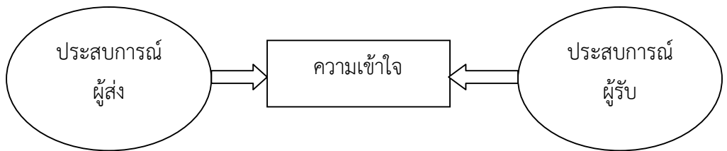
ภาพที่ 3 การสื่อสารจะมีประสิทธิภาพ

ซึ่งการตีความและความหมายแก่สารจะตรงมากขึ้นเพียงใด ขึ้นอยู่กับทั้งผู้ส่งและผู้รับสาร ซึ่งหมายถึง ประสบการณ์และความหมายร่วมกัน ถ้าทั้ง 2 ฝ่ายมีประสบการณ์ร่วมกันมากเท่าใด ก็จะตีความและให้ความหมายตรงกันมากขึ้น เกิดความเข้าใจได้รวดเร็ว