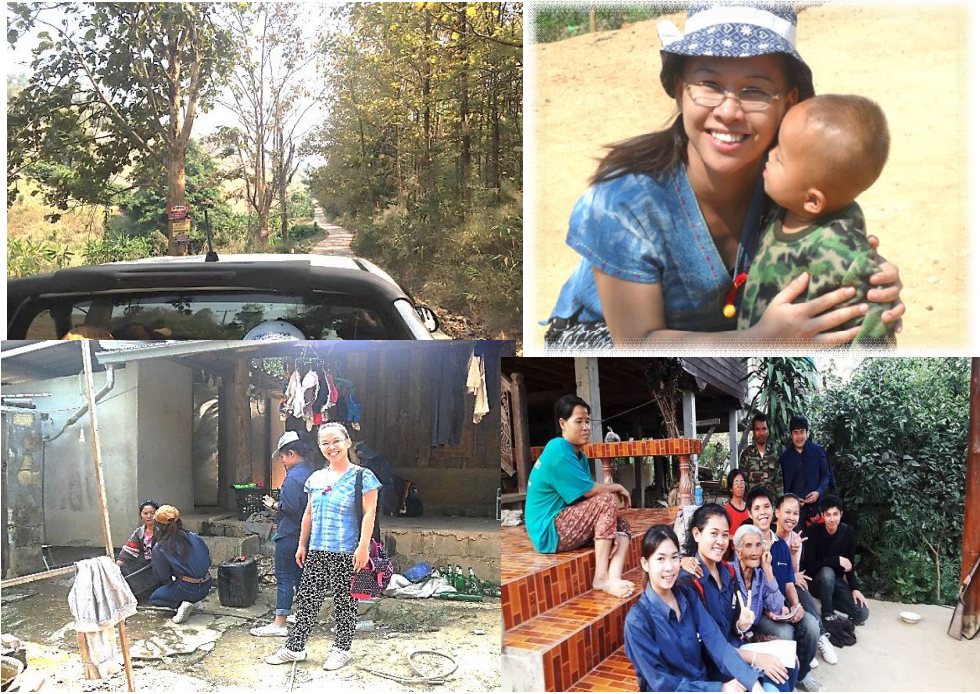
ภาพที่ 6 ประสบการณ์การเรียนรู้วิถีชีวิตและความสัมพันธ์กับชุมชน