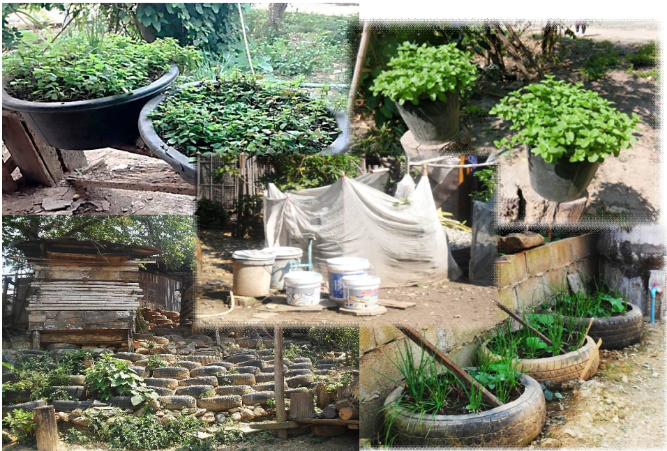
ภาพที่ 5 การใช้ประโยชน์จากของเหลือใช้ในครัวเรือนของชุมชน

ผลการสำรวจทัศนคติเกี่ยวกับความตระหนักในปัญหา หน้าที่ความรับผิดชอบและความต้องการในการฝึกอบรมด้านการจัดการขยะในชุมชนได้ชี้ให้เห็นว่า ส่วนใหญ่ตระหนักถึงการมีส่วนร่วมในการจัดการขยะในชุมชน และต้องการให้มีการจัดโครงการฝึกอบรมคัดแยกขยะ และมีประมาณหนึ่งในห้า (38 คน, ร้อยละ 19.69) ของประชากรกลุ่มตัวอย่างเท่านั้น (n=38 คน) ที่เคยมีประสบการณ์ในการเข้ารับการฝึกอบรมเกี่ยวกับการจัดการขยะในชุมชน เนื่องด้วยส่วนใหญ่มีฐานะยากจน การเดินทางมาร่วมกิจกรรมของตำบลส่วนใหญ่จึงอาศัยยานพาหนะของผู้ใหญ่บ้าน โดยเฉพาะห้าหมู่บ้านข้างต้น (หมู่ที่ 5, หมู่ที่ 6, หมู่ที่ 7, และหมู่ที่ 8) ที่สภาพพื้นที่เป็นอุปสรรคในการเดินทาง นอกจากนี้ ประชาชนหมู่ที่ 6 บ้านสวนป่าทั้งหมดเป็นผู้ที่อพยพมาจากพื้นที่อื่น ซึ่งอาจทำให้ไม่รู้ลึกถึงความเป็นส่วนหนึ่งของชุมชนมากนัก ส่วนชนเผ่าม้งในพื้นที่ หมู่ที่ 8 บ้านครกหนานทา อาจมีความรู้สึกแตกต่างพิจารณาจากคำเรียกขานกลุ่มตนว่า “คนบ้านบน” และเรียกคนพื้นเมืองว่า “คนเมือง” ที่มักจะเรียกชนเผ่าม้งว่า “แม้ว” โดยนัยแห่งการเรียกขานเป็นการแบ่งแยกระหว่างคนพื้นเมืองกับชนเผ่า การเป็นส่วนหนึ่งหรือหมู่บ้านหนึ่งในตำบลจึงเป็นแค่การแบ่งเขตการปกครอง หากใช้ความรู้สึกเป็นอันหนึ่งอันเดียวกันไม่ (นภาพวีณ์ เมสนุกูล และคณะ, มปป., น. 1)