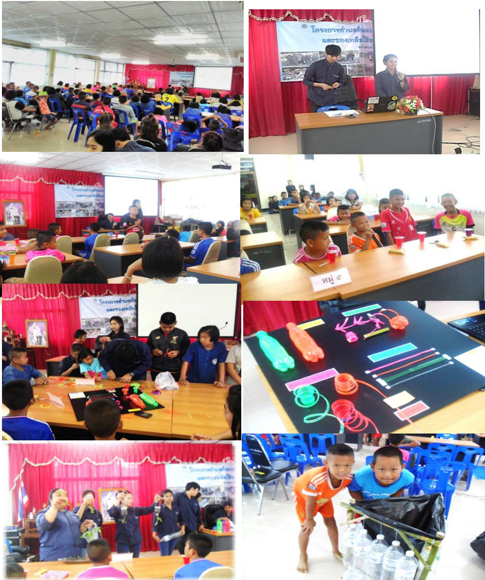
ภาพที่ 8 กิจกรรมอบรมเชิงปฏิบัติการการตัดแยกขยะและการจัดการ เพื่อสร้างอรรถประโยชน์สำหรับเด็กและเยาวชนตำบลห้วยโรง

ตำบลห้วยโรง ผู้นำชุมชน ประชาชน กลุ่มเด็กและเยาวชนในพื้นที่ ทำให้คนในชุมชนได้รู้จักมหาวิทยาลัยแม่โจ้ มากยิ่งขึ้น