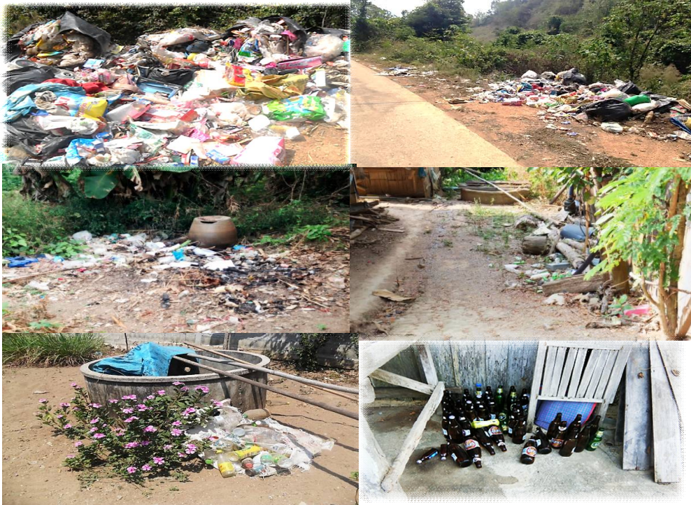
ภาพที่ 4 ขยะที่สำรวจพบในพื้นที่

และขมนั้น ส่วนหนึ่งมาจากการบริโภคของเด็กและเยาวชนในพื้นที่ ผลการศึกษาดังกล่าว จึงสะท้อนปัญหาขยะที่มาจากคนสองกลุ่ม คือ ประชาชนทั่วไปและกลุ่มเด็กและเยาวชนในพื้นที่