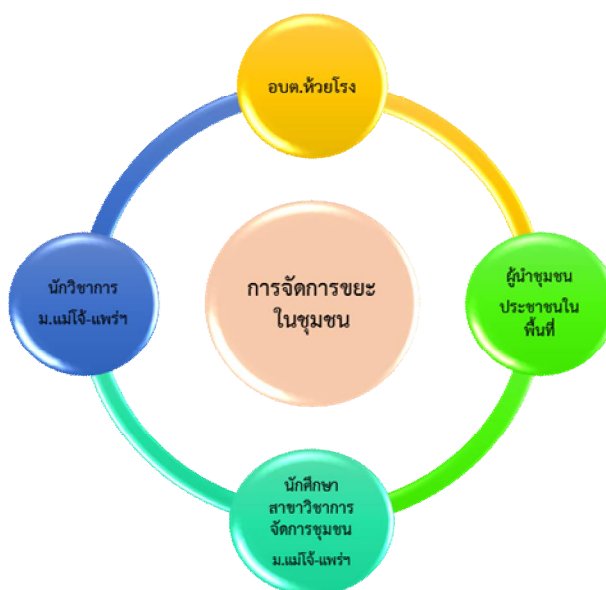
ภาพที่ 2 พหุภาคีการพัฒนา