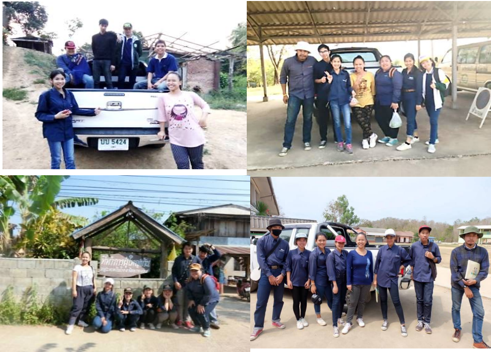
ภาพที่ 3 คณะสำรวจขยะในพื้นที่ตำบลห้วยโรง

ผลการสำรวจ พบว่า ขยะในครัวเรือน ส่วนใหญ่เป็นขยะรีไซเคิล รองลงมาคือขยะทั่วไป ส่วนในพื้นที่การเกษตร พบขยะอินทรีย์มากที่สุด ขยะรีไซเคิลที่พบในครัวเรือนส่วนใหญ่ กอทิ้งไว้บริเวณลานบ้าน โคนต้นไม้ (ภาพที่ 4) เพื่อรอจำหน่ายให้รถรับซื้อขยะและของเก่า ซึ่งเข้ามาในพื้นที่ไม่บ่อยครั้งนัก และบางช่วงเวลาประชาชนส่วนใหญ่ทำงานอยู่ในพื้นที่ การเกษตรหรือเข้าป่าล่าสัตว์ ทำให้มีขยะรีไซเคิล เช่น ขวดแก้ว ขวดพลาสติก และกระป๋อง เครื่องดื่มสะสมในพื้นที่จำนวนมาก ถึงแม้ว่ามีบางครัวเรือนได้ตัดแปลงของเหลือใช้บางส่วน เพื่อใช้ประโยชน์ในครัวเรือนแล้วก็ตาม (ภาพที่ 5) ทำให้ 4 หมู่บ้านจากทั้งหมด 8 หมู่บ้านของ ตำบลห้วยโรง ได้แก่ หมู่ที่ 5 บ้านน้ำพุสูง หมู่ที่ 6 บ้านสวนป่า หมู่ที่ 7 บ้านน้ำพุน้อย และ หมู่ที่ 8 บ้านครกหนานทา ต้องการให้มีบริการจัดเก็บขยะ เนื่องจาก เส้นทางภายในหมู่บ้านเป็น ถนนคอนกรีตขนาดเล็กและเลียบตามไหล่เขา ทำให้การเดินทางเพื่อนำขยะมาจำหน่ายยังร้านรับซื้อซึ่งอยู่ห่างจากพื้นที่ตำบลห้วยโรงประมาณ 32 กิโลเมตรนั้นค่อนข้างยากลำบากและใช้เวลาในการเดินทางนาน นอกจากนี้ ขยะทั่วไปหรือขยะแห้งที่ไม่สามารถนำไปรีไซเคิล ยกตัวอย่างเช่น ถูพลาสติก ซองบะหมี่กึ่งสำเร็จรูป ซองลูกอม กล่องโฟม พอยล์บรรจุอาหาร