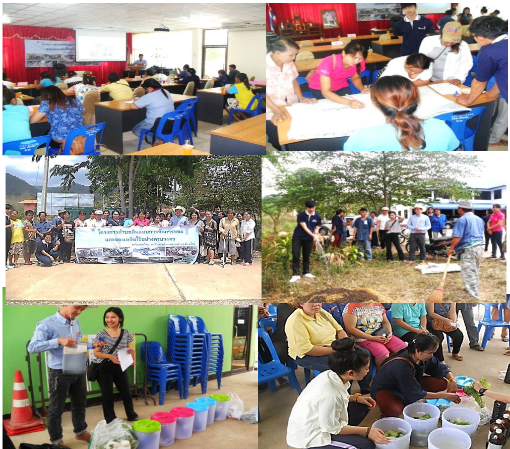
ภาพที่ 7 กิจกรรมทำน้ำหมักชีวภาพจากขยะในครัวเรือน และปุ๋ยหมักจากขยะอินทรีย์ในครัวเรือนและวัสดุเหลือใช้จากพื้นที่การเกษตร

โดยกิจกรรมดังกล่าวมีนักศึกษาสาขาการจัดการชุมชน ชั้นปีที่ 4 ที่ลงทะเบียนในรายวิชา กข 322 การวางแผนและพัฒนาทรัพยากรมนุษย์ในชุมชน ฝึกปฏิบัตินอกชั้นเรียน ในการทำหน้าที่เป็นวิทยากรประจำกลุ่ม สังเกตการณ์และฝึกทักษะการเป็นผู้ช่วยวิทยากร ก่อนที่จะฝึกเป็นวิทยากรในหลักสูตรที่ 2 สำหรับเด็กและเยาวชน ฉะนั้น โครงการพัฒนา ดังกล่าวนอกจากจะเป็นความร่วมมือรูปแบบพหุภาคีที่ใช้วิธีการทำงานร่วมกันแล้วนั้น (อภิชาติ ใจอารีย์, 2559, น. 124-125) ยังเป็นการสร้างความรู้ (Knowledge) และทักษะปฏิบัตินอกชั้นเรียน (Skills) ให้กับนักศึกษาเพื่อให้สามารถปฏิบัติงานได้จริงเมื่อสำเร็จการศึกษา (ดารณี พิมพ์ช่างทอง และอภิตดา สุทธิสานนท์, 2558, น.18; วิกานดา ใหม่เพย, 2561, น.174; วิกานดา ใหม่เพย, 2562, น. 26) และยังก่อให้เกิดองค์ความรู้ใหม่แก่ผู้นำ ประชาชน องค์กร