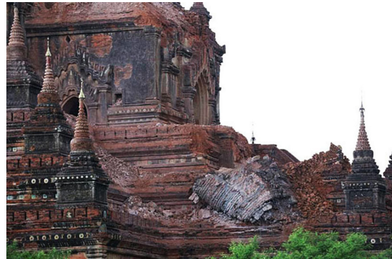
เกิดเหตุแผ่นดินไหวในพม่า ความรุนแรงระดับ ๖.๘ ทำให้เจดีย์สมัยอาณาจักรพุกามต่างๆพังทลายเสียหายอย่างมาก