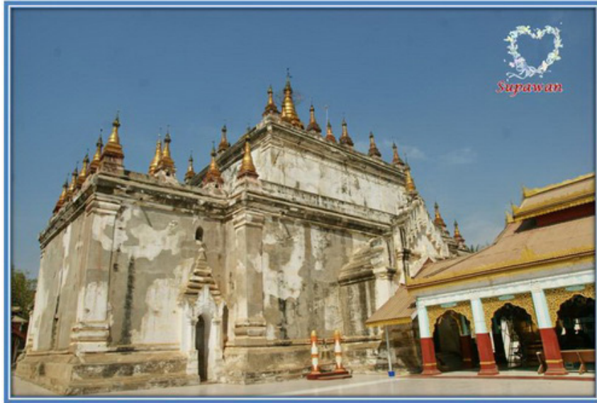
๘. พระมหาเจดีย์มณูหา (เจดีย์กู่ มณูหา) เป็นศิลปะแบบมอญ คนไทยเรียกว่าวัดพระเจ้าอิตอัลด