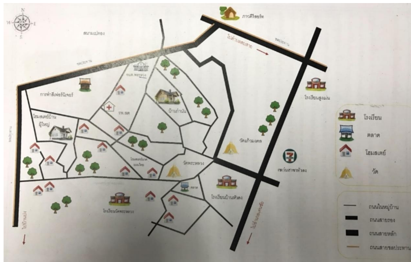
รูปที่ 2 แผนที่ทางกายภาพของชุมชนตำบลพระหลวง

2. ผลการถ่ายทอดองค์ความรู้และจัดกระบวนการเรียนรู้ที่นำไปสู่การเปลี่ยนแปลงของ ชุมชนตำบลพระหลวงโดยการใช้ทุนทางวัฒนธรรม พบว่า จากการพัฒนาชุดองค์ความรู้การ รวบรวมชุดองค์ความรู้ สำหรับการบริการวิชาการเพื่อพัฒนาคุณภาพชีวิตของชุมชนตำบลพระ หลวงโดยการใช้ทุนทางวัฒนธรรมของชุมชน