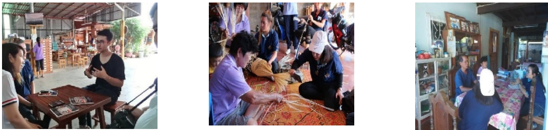
รูปที่ 1 การศึกษาภาคสนามชุมชนด้วยวิธีสัมภาษณ์

ลื้อจากเชียงแสนได้อพยพลงมาตั้งถิ่นฐานที่ป่าดง หลวง พระภิกษุ สามเณรและชาวบ้านได้ร่วมกันสร้างหมู่บ้าน และปฏิสังขรณ์บริเวณวัดที่ร้าง ขึ้นมาใหม่และได้ตั้งชื่อวัดว่าวัดพระหลวง และตั้งชื่อหมู่บ้านว่าบ้านพระหลวง เป็นชุมชนที่มีความเก่าแก่ ซึ่งมีพระธาตุหนึ่งเป็นสถานที่สำคัญของชุมชน มีวัฒนธรรมประเพณีแบบล้านนา มีภาษาของชุมชนที่เป็นเอกลักษณ์ มีความสัมพันธ์แบบเครือญาติ อาชีพในชุมชนพระหลวงที่สำคัญและเป็นเอกลักษณ์ของชุมชนได้แก่ การทำเฟอร์นิเจอร์ การทอผ้า การทำเครื่องจักสาน ซึ่งในปัจจุบันประชากรส่วนใหญ่เป็นผู้สูงอายุ โดยวัฒนธรรมวิถีชีวิตที่เป็นเอกลักษณ์ของพระ หลวง ที่ขาดการถ่ายทอดเรื่องราวไปยังลูกหลาน เนื่องจากลูกหลานไปทำงานต่างถิ่น ซึ่งคงอยู่ มาจนถึงปัจจุบัน เนื่องจากมีการติดต่อระหว่างผู้คนต่างวัฒนธรรมต่างประเพณี การเคลื่อนย้าย ถ่ายเทวัฒนธรรม ข้ามเผ่าพันธุ์จึงเกิดขึ้น ทั้งในด้านภาษา ธรรมเนียมปฏิบัติ การแต่งกาย การแสดงออก รวมทั้งอาหารการกินด้วย การผสมกลมกลืนทางวัฒนธรรมจึงเป็นสิ่งที่ค่อย ๆ เกิดขึ้นตามเวลาที่ดำเนินไป ดังนั้น จึงพบว่า อาหารบ้านพระหลวง มีการผสมกลมกลืนของ วัฒนธรรมอาหารไทลื้อและอาหารพื้นถิ่นเข้าด้วยกันจนไม่สามารถแยกออกได้ (รูปที่ 1-2)