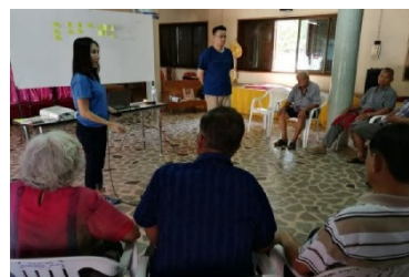
รูปที่ 3 การอภิปรายกลุ่มเพื่อร่างชุดความรู้