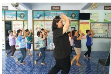
ภาพที่ 5 นำชุดความรู้ถ่ายทอดสู่ชุมชน