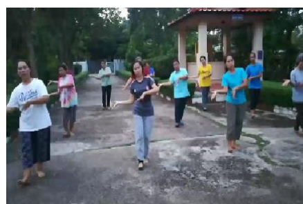
รูปที่ 4 การพัฒนาชุดองค์ความรู้ การนำชุดองค์ความรู้ไปถ่ายทอดให้กับชุมชน

คณะผู้วิจัยนำชุดองค์ความรู้ทั้ง 3 ชุดองค์ความรู้ คือ 1) ชุดองค์ความรู้ เรื่องพิธีสืบทอดและความเชื่อของคนพระหลวง 2) ชุดองค์ความรู้ เรื่องสำหรับอาหารบ้านพระหลวง และ 3) ชุดองค์ความรู้ เรื่องราวประวัติศาสตร์และของดีชุมชน และนำไปถ่ายทอดให้กับชุมชนตำบลพระหลวง รวมจำนวน 165 คน สามารถสร้างให้ ความรู้กับแกนนำของชุมชนที่เป็นเรื่องใกล้ เพื่อนำไปถ่ายทอดให้กับคนใกล้ชิดภายในครอบครัว ได้นำไปประยุกต์ใช้ในชีวิตประจำวันเกิดความตระหนักในการอนุรักษ์และสืบสาน วัฒนธรรม ของชุมชนไปยัง