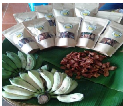
ภาพที่ 1 กลุ่มสมาชิกมีส่วนร่วมงานวิจัยและผลิตภัณฑ์ที่ได้จากงานวิจัย