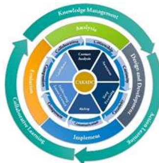
ภาพที่ 1 (ชื่อภาพ) (ถ้ามี)

ย่อหน้า (ขนาด 16 pt) ผลสรุปที่ได้จากการดำเนินการวิจัยตามวัตถุประสงค์การวิจัย