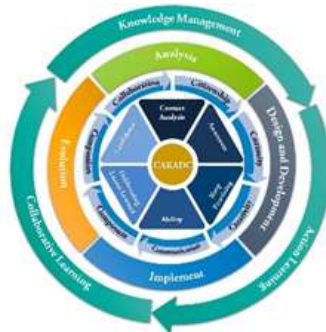
ภาพที่ 1 (ชื่อภาพ) (ถ้ามี)

ย่อหน้า (ขนาด 16 pt) ผลสรุปที่ได้จากการดำเนินการวิจัยตามวัตถุประสงค์การวิจัย