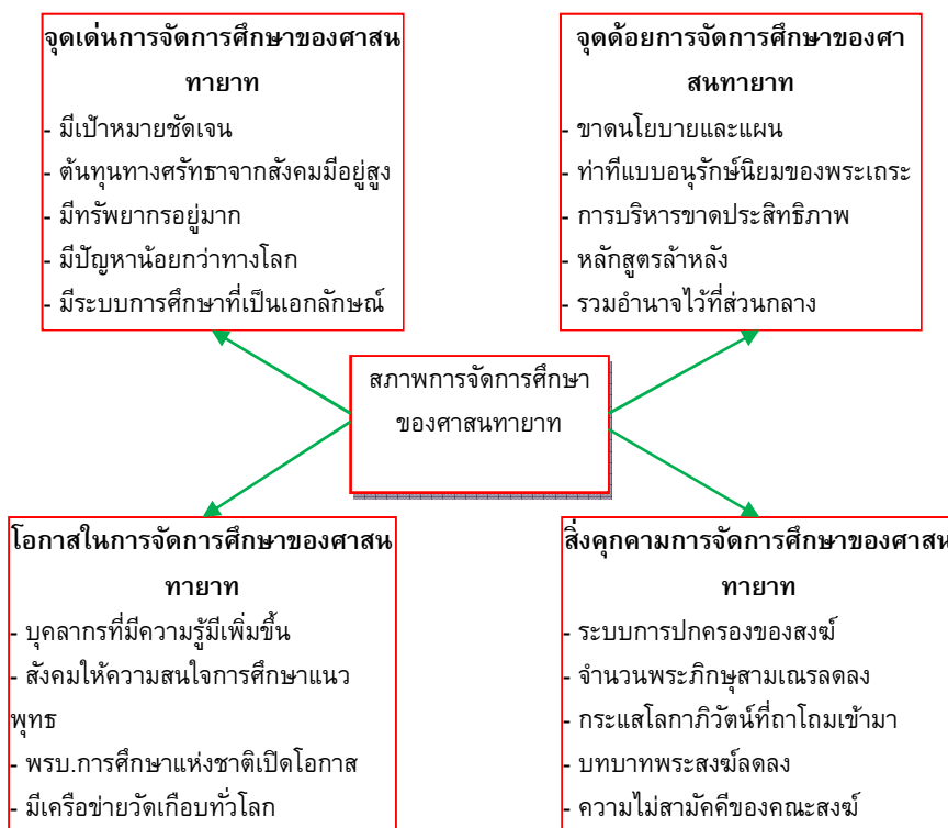
(ภาพที่ 1) : วิเคราะห์ในแง่ของ จุดเด่น จุดอ่อน โอกาส และภาวะคุกคาม

หลักสูตรการศึกษาของศาสนทายาทเป็นหลักสูตรเก่าแก่ ไม่ได้คำนึงถึงผู้ศึกษา ล้าสมัย ไม่เหมาะสมกับสภาพสังคมที่เปลี่ยนแปลงไปอย่างรวดเร็ว ตามสภาพการณ์ที่เห็นได้ชัดเจนในกรณีพระมหาเปริชญ ในระดับสูงสุดส่วนมากก็มักจะอยู่ในสำนัก ผลงานด้านวิชาการยังขาดการสนับสนุนอย่างจริงจัง เช่นควรจะต้องตั้งให้เป็นพระผู้ชำนาญการในการแต่งคัมภีร์ ต่างๆ เจกเช่นในสมัยพระศรีมังคลาจารย์ ที่มีชื่อเสียงในยุคทองของเมืองล้านนา และปัจจุบัน การแต่งคัมภีร์ ต่างๆ ภายในท้องถิ่นยังไม่ได้รับการสนับสนุน ผลงานต่างๆ ของบูรณพจารย์มักจะสูญหายไปกับบุคคล ไม่มีการสืบสานให้ถึงแก่ศิษย์รุ่นหลัง อย่างเช่นการแต่งคัมภีร์พื้นบ้านล้านนา (แต่งธรรมเนียมเหนือ ของมหาทวี เชื้อนแก้ว ยังไม่ปรากฏการบันทึกว่ามีใครเป็นศิษย์สืบทอด มีแต่คัมภีร์ แต่ยังไม่มีการถ่ายทอดในระดับมหาวิทยาลัยแต่อย่างใด