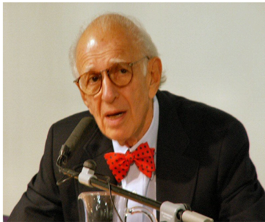
(ภาพที่ 1): Eric R. Kandel, 2000 Nobel Prize in Physiology or Medicine

คือเรื่องทีข้าพเจ้าจะแลกเปลี่ยนกับท่านในครั้งนี้ เป็นความก้าวหน้าทางวิทยาศาสตร์ ทีจะเปิดมุมมองและ ความเข้าใจธรรมชาติของผู้เรียนให้กว้างขวางลึกซึ้งขึ้น