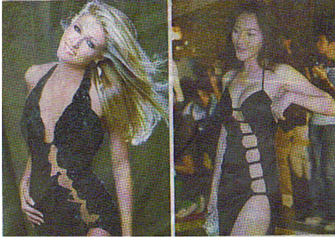
(ภาพที่ 4): การเลียนแบบการแต่งกายตามแฟชั่นมีให้เห็นจนชินตา

เมื่อเชื่อมโยงการค้นพบของอีริค อาร์ แคนเดล เข้ากับความเข้าใจเรื่องเซลล์กระจกเงา เราจะเข้าใจว่าทำไมเราจึงต้องการต้นแบบที่ดีให้จดจำ เพื่อให้เราเป็นคนเช่นที่เราเห็น ทุกครั้งที่เซลล์กระจกเงาทำงาน เมื่อเห็นภาพ (Visual) ที่ตีวงจรไฟฟ้าในเซลล์ประสาทส่วนนี้จะทำงาน ยิ่งทำงานมากเท่าใด วงจรจะยิ่งแข็งแรงเพราะมันได้ใช้งานในส่วนนี้มาก การทดลองยืนยันว่าเราใช้เซลล์สมองส่วนใดมากส่วนนั้นยิ่งแข็งแรงที่โด่งดังคือการทดลองวัดเซลล์สมองส่วน ฮิปโปแคมปัส (Hippocampus = ศูนย์บัญชาการความทรงจำ) ของคนขับรถแท็กซี่ ซึ่งนักวิจัยของมหาวิทยาลัยลอนดอน ประเทศอังกฤษสันนิษฐานว่า ฮิปโปแคมปัสของคนขับรถแท็กซี่จะมีขนาดใหญ่กว่าคนธรรมดา เนื่องจากกรุงลอนดอนมีเส้นทางที่ซับซ้อนมาก คนขับรถแท็กซี่จึงต้องใช้ความทรงจำเยอะกว่าคนปกติ ผลวิจัยออกมาเป็นจริงดังคาด ฮิปโปแคมปัสของคนขับรถแท็กซี่มีขนาดใหญ่กว่าของคนทั่วไปอย่างเห็นได้ชัด โดยเฉพาะในส่วนของ การจดจำพื้นที่ (Spatial Memory) แต่ที่น่าสนใจยิ่งไปกว่านั้นก็คือ ขนาดฮิปโปแคมปัสของคนขับรถแท็กซี่ในกรุงลอนดอนมีขนาดเท่ากับคนปกติ เนื่องจากคนขับรถแท็กซี่ขับรถบนเส้นทางเดิมทุกวัน พวกเขาจึงไม่ได้ใช้ความจำมากเท่ากับคนขับรถแท็กซี่