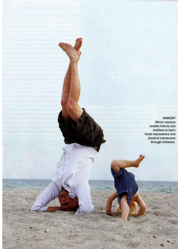
(ภาพที่ 3): เซลล์กระจกเงาในสมองทำให้เด็กเล็กสามารถเรียนรู้การเคลื่อนไหวร่างกายในท่ายากตามผู้ใหญ่ได้ โดยการเลียนแบบ

แต่สิ่งที่เราต้องสนใจและให้ความใส่ใจคือ การเรียนรู้ผ่าน "การเลียนแบบ" เป็นกลไกการทำงานโดยอัตโนมัติ ไม่ได้ผ่านการกลั่นกรองด้วยระบบคิดใคร่ครวญของสมองส่วนหน้า ว่า สิ่งที่กำลัง "เลียนแบบ" นั้นดีหรือไม่ดี ความเข้าใจเรื่องเซลล์กระจกเงาทำให้เรากระจ่างว่าทำไมพิธีกรรม วัฒนธรรมที่ต่างๆตามกันมาส่วนมากก็เป็นการทำตามๆกันไป ไม่ได้เข้าใจอะไรมาก มันคือการเลียนแบบ ซึ่งเป็นระบบการเรียนรู้พื้นฐานที่มีอยู่ตามธรรมชาติของมนุษย์ ไม่จำเป็นต้องไปตำหนิมัน เพราะแ่งามที่มีประโยชน์ของการเลียนแบบนี้คือมันทำให้มนุษย์สามารถมีชีวิตอยู่ได้ง่ายขึ้น เพียงแต่อย่าหยุดแค่การเลียนแบบ เราต้องทำงานต่ออีกนิด เพื่อพากันเข้าไปถึงแก่นแท้ของสิ่งที่กำลังทำอยู่