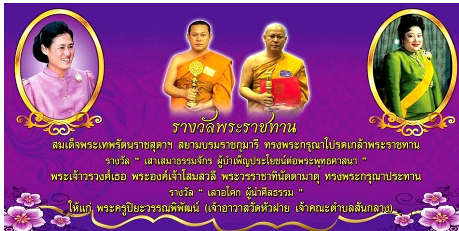
ภาพประกอบที่ 1: ป้ายประกาศสัมพันธกิจกรรมของกิจกรรมในทางพระพุทธศาสนา

นอกจากนี้ ยังมีกิจกรรมในการสร้างความเข้มแข็งของชุมชนอีกหลากหลายกิจกรรม จากข้อมูลและความน่าสนใจของพื้นที่ คณะผู้วิจัยจึงต้องการศึกษาบริบทของชุมชนหัวฝายเพื่อวิเคราะห์ภูมิหลังทางประวัติศาสตร์ที่มีผลต่อการก่อเกิดโรงเรียนผู้สูงอายุวัดหัวฝาย และกระบวนการบริหารจัดการโรงเรียนผู้สูงอายุวัดหัวฝายที่นำไปสู่การสร้างความเข้มแข็งของชุมชน รวมถึงผลสำเร็จของการเป็นชุมชนเข้มแข็งชุมชนหัวฝาย ตำบลสันกลาง อำเภอพาน จังหวัดเชียงราย