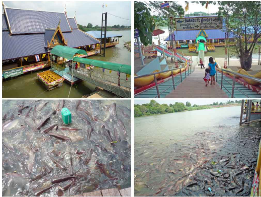
ภาพที่ 3 แพสำหรับให้อาหารปลา